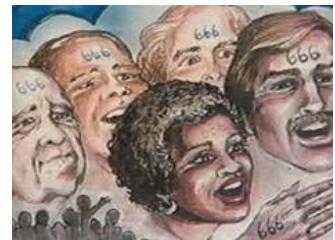
С Н И Л С – «Социальный Номер